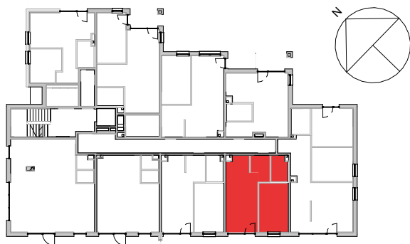
USYTUOWANIE LOKALU W BUDYNKU

UWAGA. Do pomiarów powierzchni przyjęto wykończenie ścian tynkiem o grubości 1,5cm