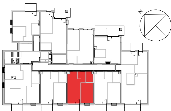
USYTUOWANIE LOKALU W BUDYNKU

UWAGA. Do pomiarów powierzchni przyjęto wykończenie ścian tynkiem o grubości 1,5cm