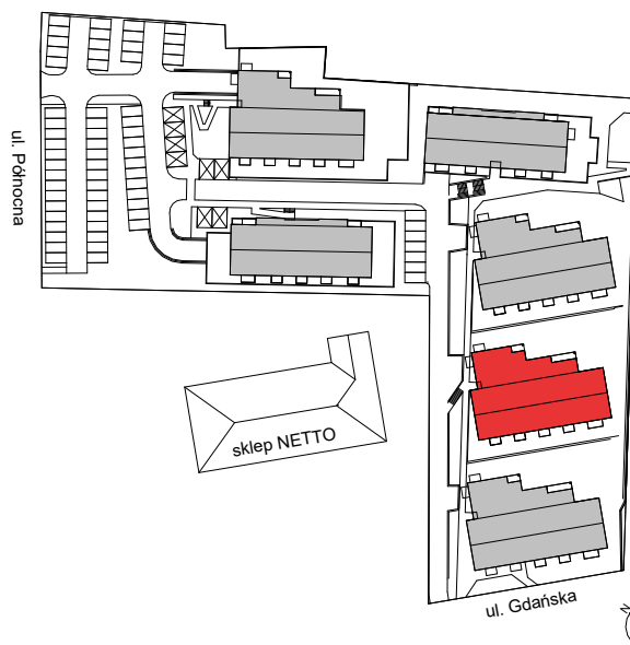
USYTUOWANIE BUDYNKU NA DZIAŁCE